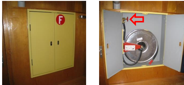
Bild: Löschposten in der Garderobe EG.

Der Feuerlöschposten, auch Wandhydrant genannt, dient im Brandfall als sofort einsatzbereite Löschleitung für die Selbsthilfe der Hausbewohner. Mit der Schlauchlänge von 30m können alle Räume im Haus erreicht werden. Bevor man den Schlauch abrollt, unbedingt den Feuerhahn aufdrehen, sonst wird am Strahlrohr kein Wasser fließen!